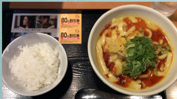
辛吉カレーうどん