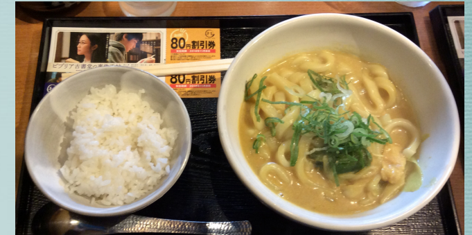
千吉カレーうどん